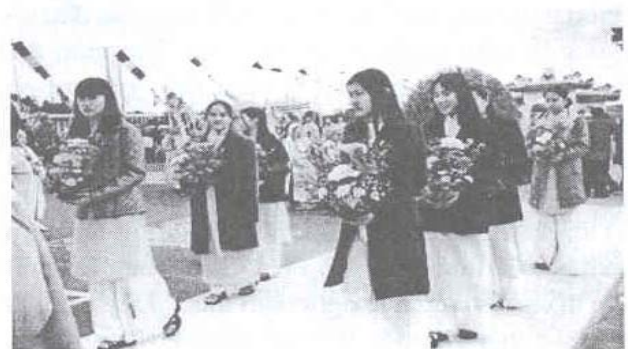
Gia đình Phật tử cung thỉnh Chư Tôn Đức quang lâm lễ đài