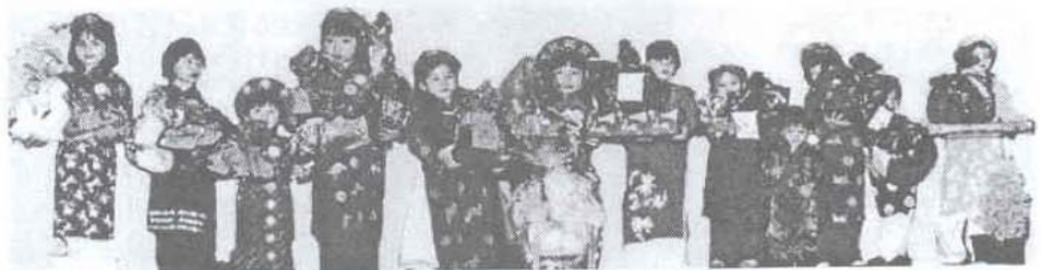
Thiếu nhi, rường cột nước nhà. Quang cảnh buổi lễ trao quà ngày Quốc phục Thiếu nhi