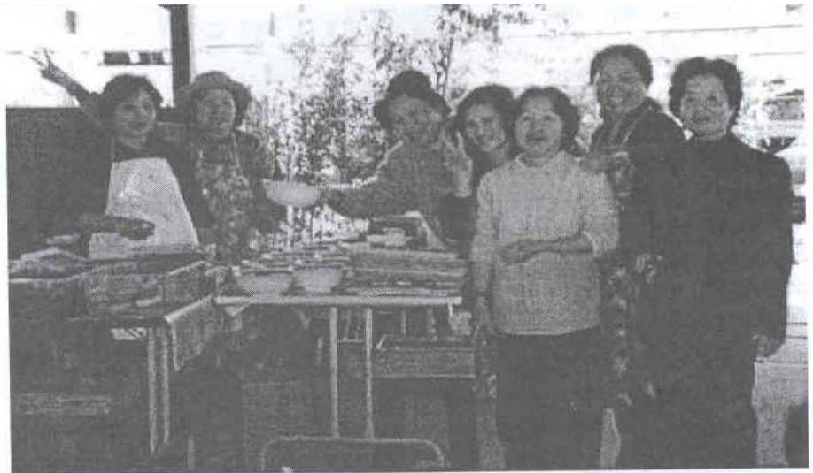
Đến Quang Minh ngày lễ hội, không thể thiếu món chay mang về cho gia đình