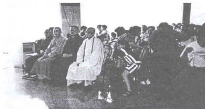
Tổng vụ Xã hội tổ chức tiệc chay gây quỹ cứu trợ thiên tai tại Việt Nam.

số niệm Phật công cứ của quý liên hữu để trình lên cho Hòa Thượng Liên Trưởng. Có những liên hữu niệm Phật 20 chẩm mỗi ngày.