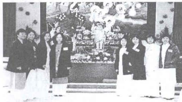
Những thiếu nữ Quang minh trong Ban Tiếp tân ngày lễ Phật đản