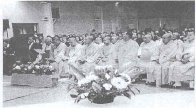
Chư Tôn Đức nhân ngày Vu Lan tại Quang Minh

vui vẻ khi ra về. Hỏi ra ai cũng nói: "Dzui quá! Chương trình tu học hay quá! năm tới đi nữa!" Hóa ra Ban tổ chức có bí quyết gì đây mà được đông người và kết quả